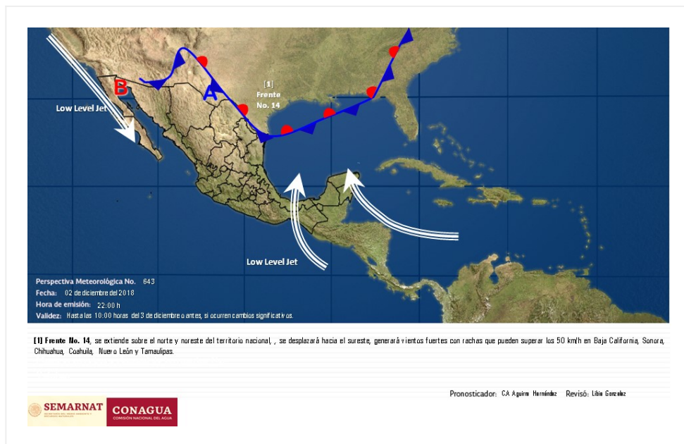
Perspectiva Meteorológica de las 10:00 horas.