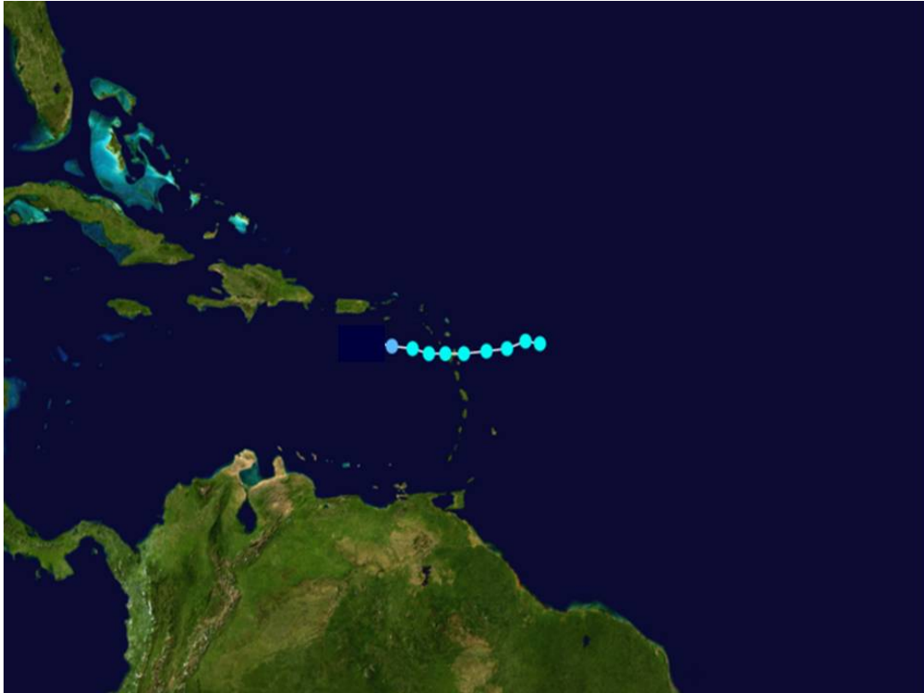
Trayectoria final de la tormenta tropical "Erika" del 1 al 3 de septiembre de 2009